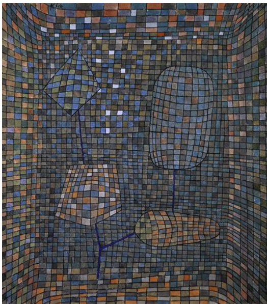
Abb. 1: Paul Klee, Künstliche Symbiose, 1934

Paul Klee ist in Japan nicht nur bei einem breiten Publikum sehr beliebt, das sich von Klees Ästhetik angesprochen fühlt. Seine künstlerische Haltung, Ästhetik und sein Denken gaben einigen Protagonisten verschiedener Kunstsparten – z.B. Toru Takemitsu, Shuntaro Tanikawa und Toyo Ito – wichtige Impulse für ihr eigenes kreatives Schaffen. Worin liegen Japans ästhetische und geistige Affinitäten zu Klees Kunst? Mit dieser Fragestellung soll in west-östlicher Intermedialität die Aktualität von Klees Kunst in einer globalisierten Welt verdeutlicht werden.