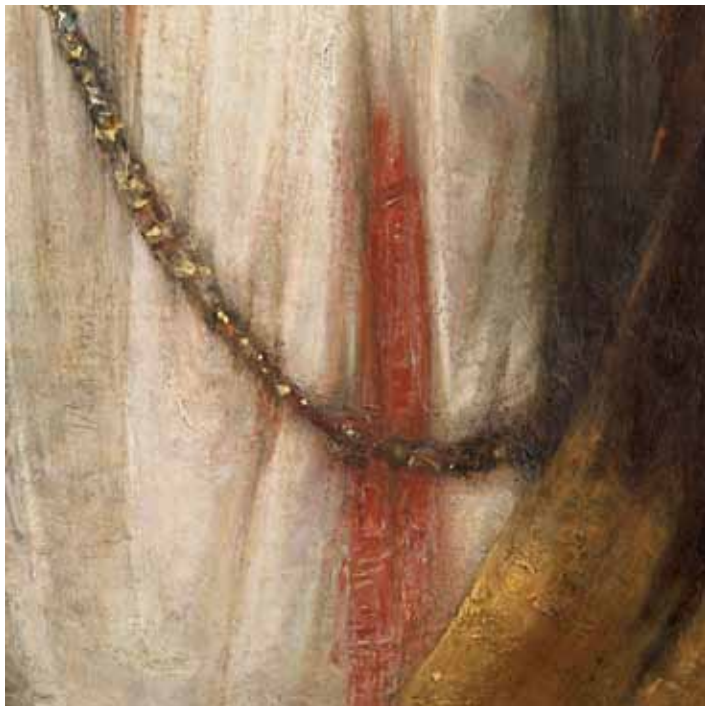
3. REMBRANDT, Lucrèce , détail, 1666, huile sur toile, 110,2 x 92,3 cm, Minneapolis, Minneapolis Institute of Arts, The William Hood Dunwoody Fund.

agrippant un cordon. Rembrandt ne nous montre pas à proprement parler la lésion provoquée par le coup de couteau à même le corps mais nous la révèle de façon ingénieuse : la chemise de Lucrèce absorbe le sang qui jaillit hors de la plaie. Le fin tissu gorgé de sang se plaque, formant deux plis verticaux bien visibles qui permettent de cerner le lieu de la blessure.