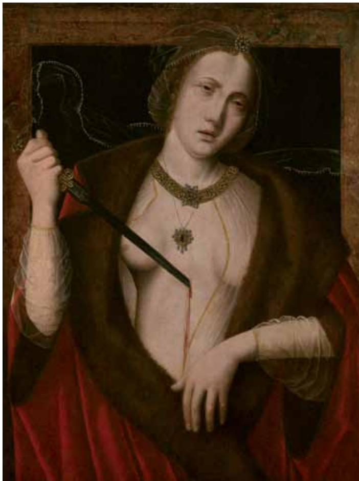
14. MAÎTRE DU SAINT-SANG, Lucrèce , c. 1520-1525, huile sur panneau, 56,5 x 42,6 cm, Prague, Národní Galerie.

personnage peint comme une figure à peine sortie de son cadre, tel un portrait qui se serait rendu vivant (fig. 15). Le second plan reprend bel et bien le format du tableau mais est ici en marbre feint, comme c'est le plus souvent le cas 31 .