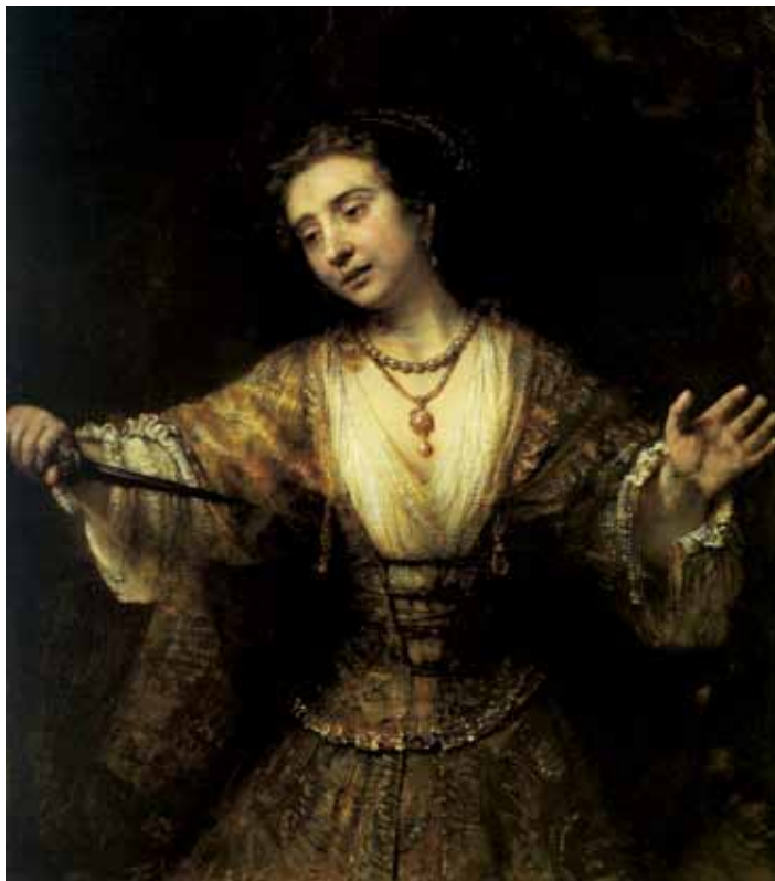
1. REMBRANDT, Lucrèce , 1664, huile sur toile, 120 x 101 cm, Washington, National Gallery of Art.

un close-up dramatique sur la figure de Lucrèce, offerte au regard de tous. Si les deux images participent assurément d'une même stratégie d'exposition, il apparaît clairement en revanche qu'elles insistent sur deux moments différents de la tragédie. Exposées côte à côte, elles manifestent un jeu de séquence avant/après le coup de couteau que s'inflige Lucrèce.