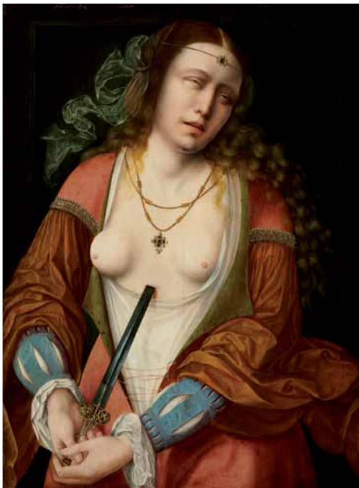
16. MAÎTRE DU SAINT-SANG, Lucretie , c. 1520-1525, huile sur panneau, 65 x 48,5 cm, Budapest, Szépművészeti Múzeum.

trop occupée à planter le couteau dans la poitrine, se soucie peu de la recouvrir. Les deux mains de Lucretie exemplifient à merveille le binôme ouverture/clôture constitutif de l'exposition des deux agressions portées sur le corps féminin : il est une agression que l'on peut dévoiler alors que l'on doit occulter l'autre, conscient toutefois que, paradoxalement, l'on marque toujours une insistance focale sur les parties que l'on prétend couvrir.