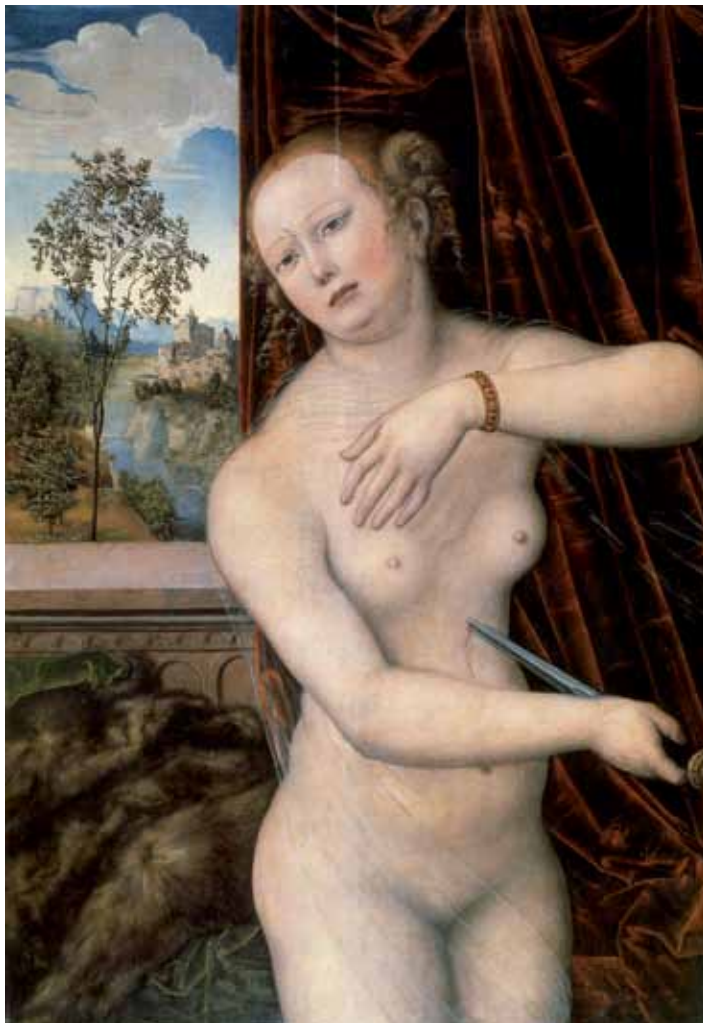
11. LUCAS CRANACH L'ANCIEN, Lucrèce , c. 1518, huile sur panneau, 86 x 58 cm, Coburg, Kunstsammlungen der Veste Coburg.

Mais si nous considérons en premier lieu les variations d'ouverture et de clôture du corps en exposition – mêlant peau, sang et voile – qui sont en jeu dans le tableau de Rembrandt, alors le développement de telles stratégies de représentation semble plus encore se manifester dans la production flamande de Lucretias , à cette même période.