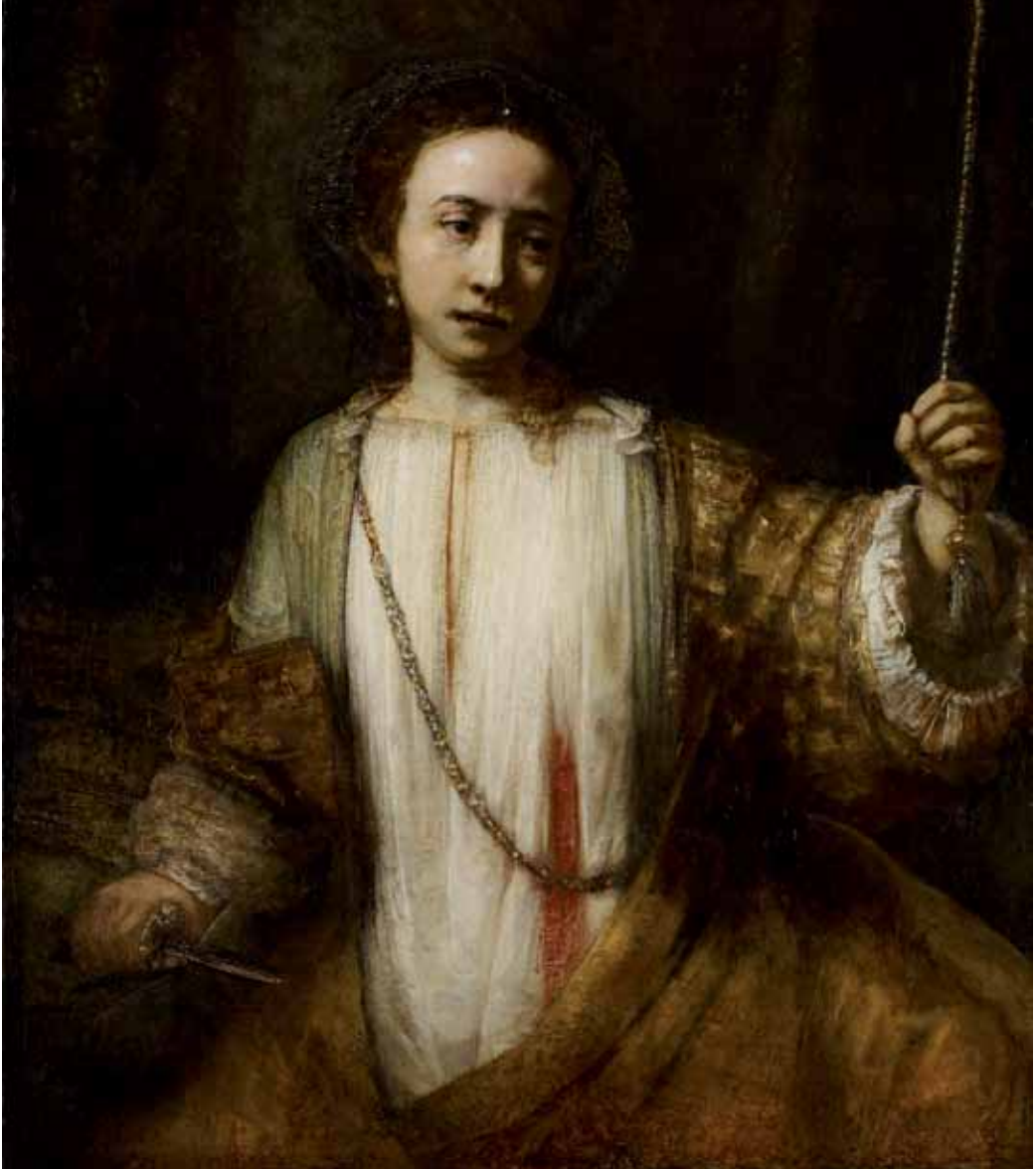
2. REMBRANDT, Lucretia , 1666, huile sur toile, 110,2 x 92,3 cm, Minneapolis, Minneapolis Institute of Arts, The William Hood Dunwoody Fund.

du crime. La manche gauche est ouverte, mettant à nu la face intérieure de son avant-bras.