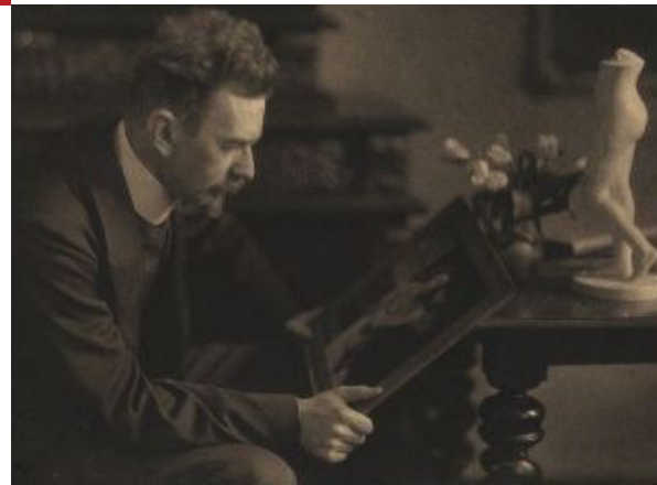
16. Februar 2012 Universität Zürich Kunsthistorisches Institut