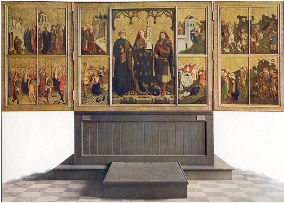
2 Barbaraaltar, 1447, Barbarakirche in Breslau, Zustand vor 1945

hier eine Parallele zum Typus der Sancta facies gezogen werden. Dieser wurde in der Schule des Meisters des Breslauer Barbaraaltars, der herausragenden Werkstatt im mittelalterlichen Schlesien, deren Œuvre Adam Labuda in seinem Buch ausführlich beschrieben hat, kreiert (Abb. 2). 6 Ein detaillierter Vergleich des Neisser Bildes mit einer Vera Ikon aus Liegnitz (Legnica) aus dieser Werkstatt, die eine ähnliche Figur des gemarterten Antlitzes Christi auf einem mit einer fiktiven Inschrift versehenen Tuch zeigt 7 , scheint sowohl die ursprüngliche typologische Verbindung beider Werke