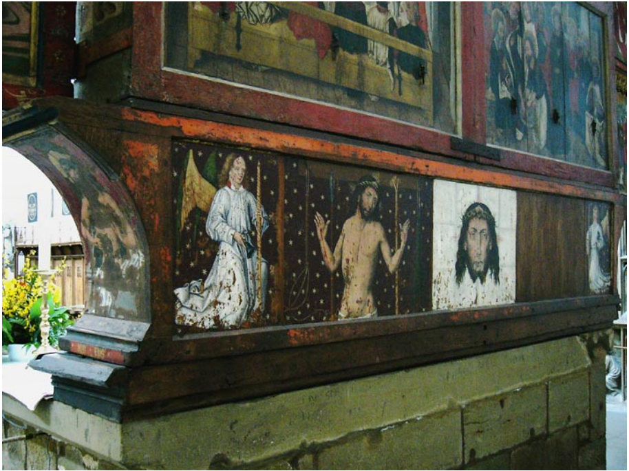
4 Friedrich Herlin (Werkstatt), Hochaltar, Rückseite der Predella, 1466, Jakobskirche, Rothenburg ob der Tauber

Sakramentsnische links vom Altar zu sehen ist, auf der Retabelrückseite auch die Vera Ikon zentral dargestellt. Da in ihrem Tuch die Spuren der Faltung zu sehen sind, ruft diese Darstellung eine offensichtliche Parallele mit dem während der Messe vom Zelebrant genutzten und nach dem Entfalten mit quadratischen Feldern gekennzeichneten corporale hervor (Abb. 4). 16 In diesem Bild sind im übrigen auch die markanten Abnutzungserscheinungen des Sancta facies zu sehen und zwar vor allem im Bereich des Mundes und der unteren Tuhecken. Daß gerade die letztgenannten im Laufe der Zeit eine solche Abnutzung erfahren haben, scheint von Bedeutung. Die ursprüngliche Wahrnehmung dieses Bildes kann nämlich als Resultat einer natürlichen und einfachen Konnotation begriffen werden. Die unteren Ecken des Tuches werden, im Gegensatz zu den oberen, normalerweise beim Aufhängen des Tuches nicht auf-