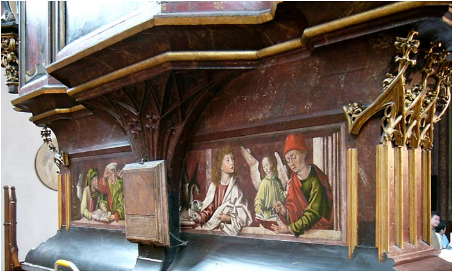
3 Michael Pacher, Marienaltar, Rückseite der Predella, 1481, Pfarrkirche, St. Wolfgang im Salzammergut