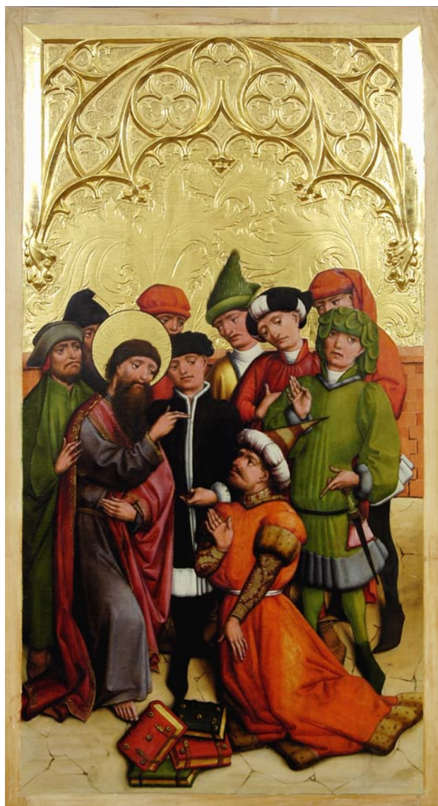
5 Jakob mit Hermogenes, Tafel des Neisser Altars, um 1450, Zustand nach der Restaurierung 2006, Erzdiözesanmuseum in Breslau (Muzeum Archidiecezjalne we Wrocławiu)

gespannt, sondern bleiben locker und frei hängen. Sie können also berührt oder im Rahmen des Rituals der osculatio geküßt werden. Die Darstellung des Tuches sowie die Abnutzungsspuren an den unteren Tuchecken scheinen hier also die Praxis mit dem eigentlichen, zum Kontakt ausgestellten Tuch wiederzuspiegeln. Es ist dabei der Erwähnung wert, daß die eigentliche mobile Bildtafel, welche im Mittelalter während der Messe den Laien zum Küssen als »Paxbild« ( tabula pacis, osculatorium ) gereicht wurde, meistens mit einer Szene der Kreuzigung oder mit einer Vera Ikon versehen war und normalerweise zur Ausstattung der Altarmensa gehörte.