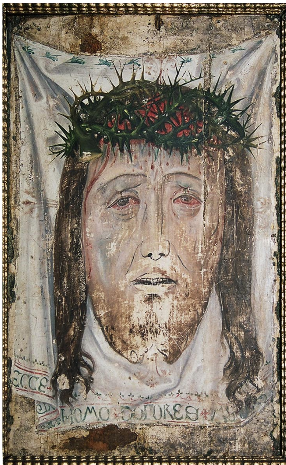
1 Vera Ikon, nach 1450?, Museum in Neisse (Muzeum w Nysie)